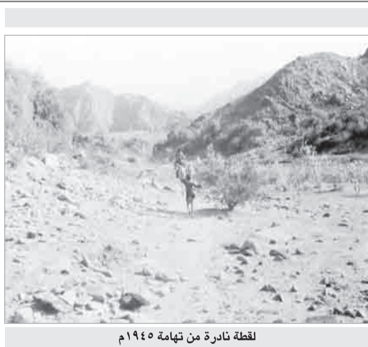
لقطة نادرة من تهامة ١٩٤٥م

العمل في الشارع الجديد الذي تقوم بلدية المدينة المنورة بافتتاحه من امام باب المجيدي ماراً بالساحة حتى المناخة. يسير بأسلوب السلخانة.. هذا بالاضافة الى ان احدث الآلات المستخدمة في العمل بهذا الشارع هي المسحة والزنبيل.