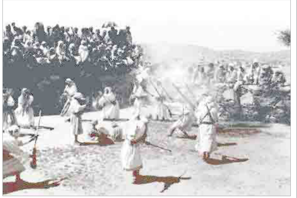
مجموعة من قبيلة عنزة

هذه المواد نشرت بتاريخ 12 - 3 - 1383 هـ 8/ 3 / 1963م