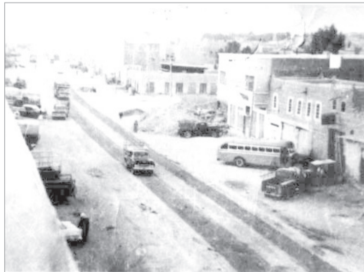
من مدينة الرياض